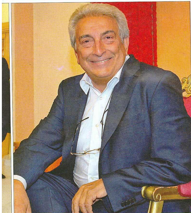
La morale de "I promessi sposi" di Guardi: «I tempi cambiano e la vita continua a essere uguale», ci dice il regista

tori de "I fatti vostri", nipote di Pippo Flora ndr) ci ha detto: "Avete in mano una bomba atomica ma la usate come un petardo". Ha chiamato un maestro, ha fatto scrivere ciò che noi avevamo lasciato alla memoria e ha rimesso in moto la macchina.