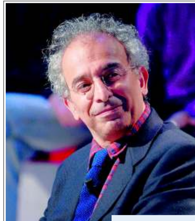
CITTADINO DEL MONDO