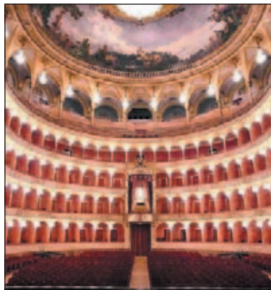
Il Teatro dell'Opera

Solo martedì le Rappresentanze di Base del Teatro dell'Opera di Roma avevano chiesto a Napolitano di non firmare il provvedimento in quanto «ha profili di dubbia costituzionalità ed un contenuto di urgenza ingiustificata anche rispetto all'uso del provvedimento decretativo» che «abrogando in larga parte la legge 800 del 1967, snatura la funzione culturale-pedagogica delle Fondazioni e cancella di fatto il sostegno dello Stato alla formazione culturale e sociale della collettività nazionale».