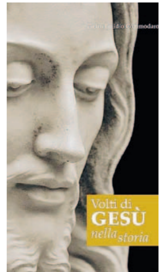
La copertina della ricerca

"I volti di Gesù nella storia" è un'opera unica nelle descrizioni e nella contemplazione, che svela il mistero di Cristo nella storia dell'umanità anche attraverso la preziosità dell'arte