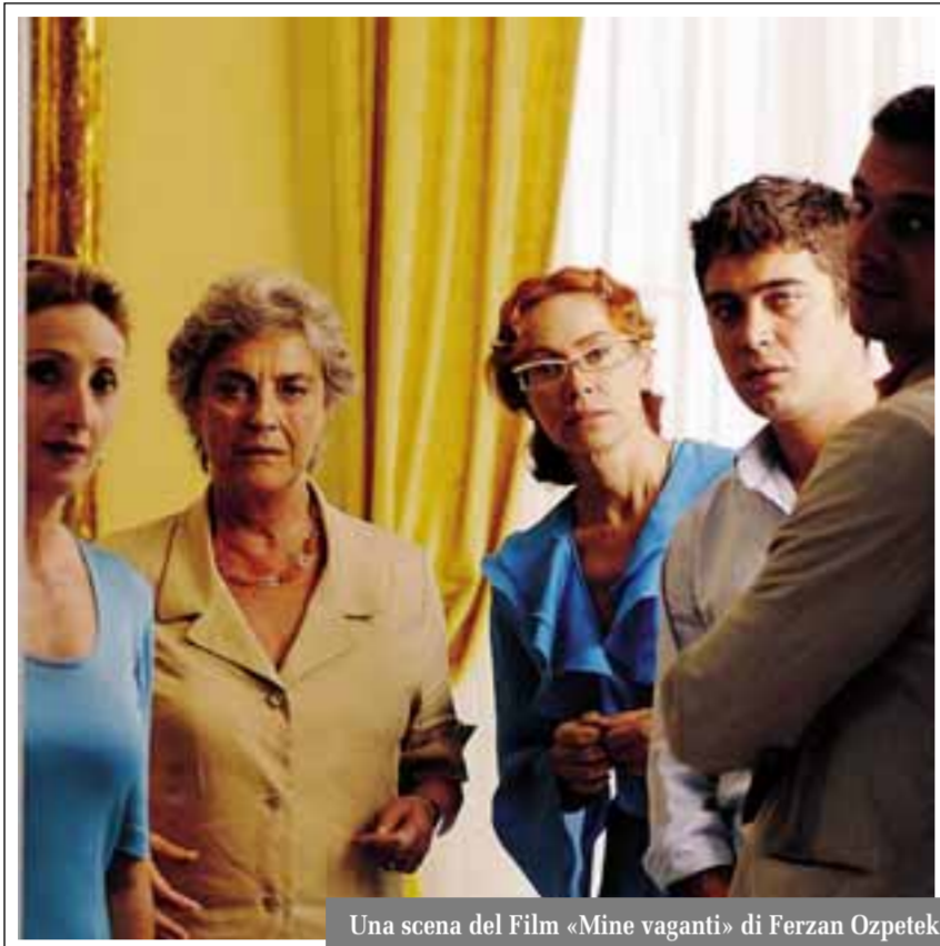
Una scena del film «Mine vaganti» di Ferzan Ozpetek

Ex aequo Sandrelli e Ramazzotti migliori attrici, come De Sica e Germano. Virzì miglior regista Nastri d'argento: più di Mine vaganti vince il fair play