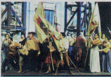
La scena della rivolta del popolo che, affamato, va all'assalto dei forni di Milano per cercare il pane.