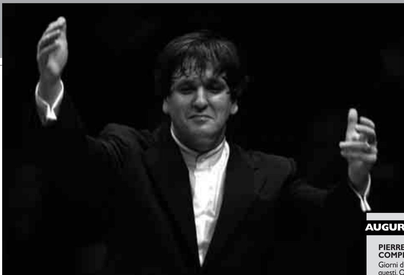
Il direttore d'orchestra Antonio Pappano. Sotto l'attore americano Dennis Hopper.

Più collaborazione. Quella che manca al mondo di oggi dove si ragiona per schemi contrapposti, per gruppi di appartenenza. La tv ci mostra un partito contro l'altro, un'idea contro l'altra. E questo non è edificante. Perché sembra che l'unica ragione di vita sia quella di combattere l'altro e non costruire il bene di tutti. Purtroppo la politica, in Italia come in qualsiasi altro paese del mondo, in questo ha grandi responsabilità. Raccontava del dolore, di come è entrato nella sua vita... E di come continui a bussare alla mia porta. In questo periodo mia suocera sta passando un momento difficile. E negli ultimi mesi ho visto andare via molte persone a me care, ancora giovani. Fatti che inevitabilmente ti interrogano. E come ha cercato di rispondere? Con l'obbligo del lavoro. Della vita. Continuare nella nostra quotidianità aiuta. Poi ho la fortuna di fare musica. E di trovare nei brani che dirigo un'energia che aiuta a continuare. Trova conforto solo nella musica? Sono profondamente credente. Per educazione familiare. Ma anche perché nella mia vita ho seguito un percorso che mi ha portato ad avere la certezza che come uomo ho bisogno di credere. Sono convinto che la componente spirituale dell'uomo vada continuamente alimentata. E sono convinto che in quanto credenti il nostro compito sia quello di rendere attuale il grande