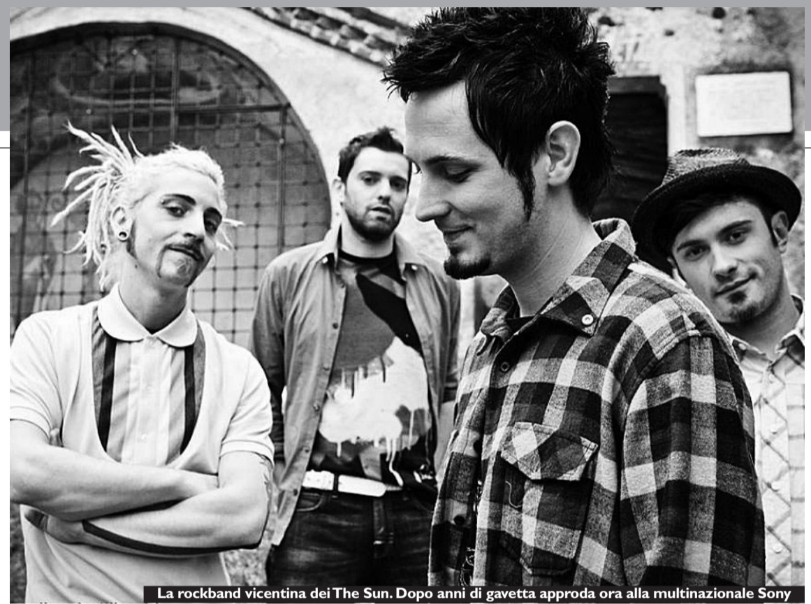
La rockband vicentina dei The Sun. Dopo anni di gavetta approda ora alla multinazionale Sony

del genere messo sotto contratto in Italia da una multinazionale. «La nostra è una piccola missione»